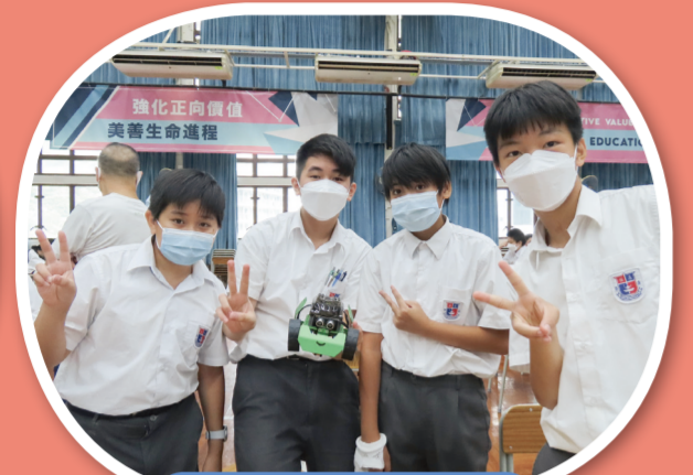
STEM DAY 創科導航