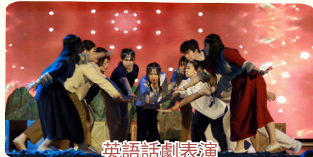
英語話劇表演 TOWARDS THE GOLDEN SHORES