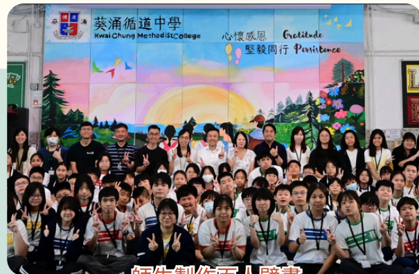
師生製作百人壁畫