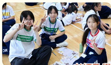
老師及學兄學姊助融入