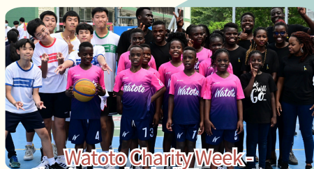
Watoto Charity Week - Charity Basketball Tournament