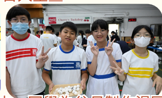
中一同學為父母製作湯圓