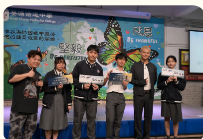
中六級打氣音樂會