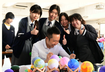
校長與同學一起參與感恩周午間福音嘉年華