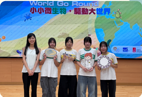
生物科國際瓊脂比賽