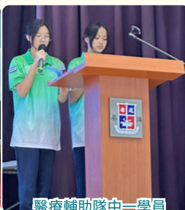
醫療輔助隊中一學員