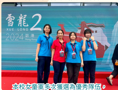
本校女童軍多次獲選為優秀隊伍， 除豐富的本地學習機會，隊員足跡亦遍歐亞

全體中一學生均需參與SMARTEENS制服團隊計劃，包括女童軍、醫療輔助隊少年團（AMS）、少年警訊（JPC）及COOL YOUTH等，透過集會、步操訓練及啟導課程，培養紀律、自律及服務精神。