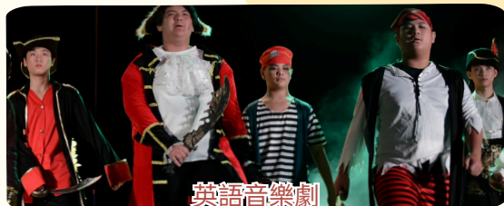
英語音樂劇 PETER PAN