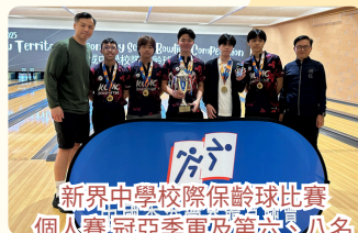
新界中學校際保齡球比賽 個人賽冠亞季軍及第六、八名 團體賽冠軍