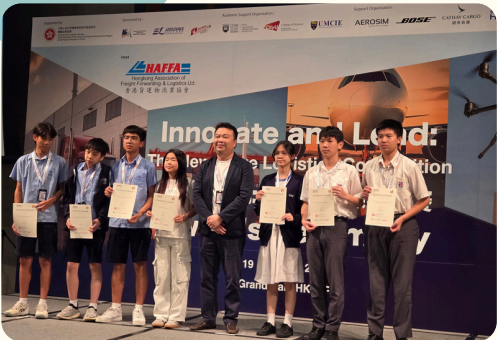
全港校際物流比賽優異獎