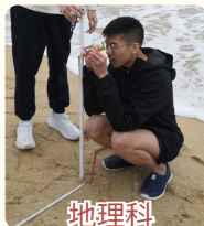
地理科 長洲海岸考察