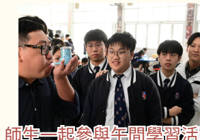
師生一起參與年間學習活動— 生物小巨肺