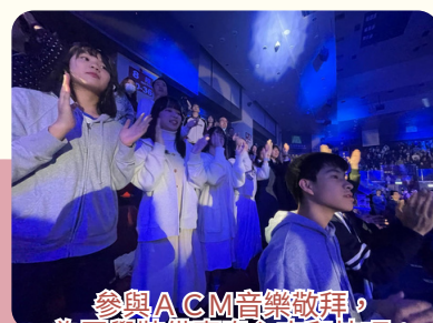
參與ACM音樂敬拜，為同學裝備事奉心志和技巧；基督徒師生組成敬拜隊同心事主