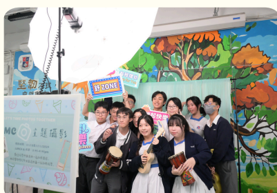
師生開心參與「舒ZONE」精神健康周攝影活動