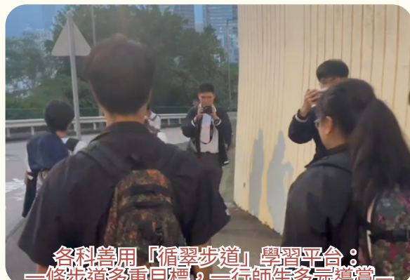
各科善用「循翠步道」學習平台： 一條步道多重目標，一行師生多元導賞－ 拍攝社區訪談、中文科文字寫生， 發揮學校環境，釋放無限學習可能。