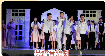
英語音樂劇 THE SOUND OF MUSIC