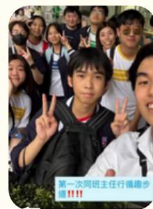
師生同行 共建美好足印