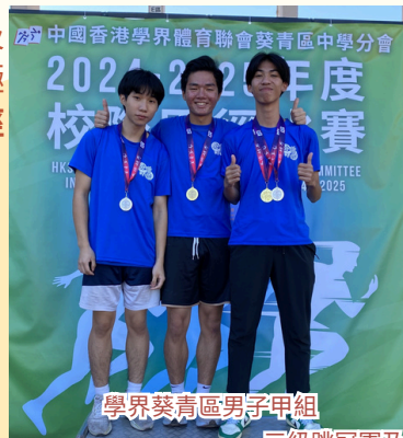
學界葵青區男子甲組 標槍亞軍 標槍冠軍 三級跳冠軍及 跳遠亞軍