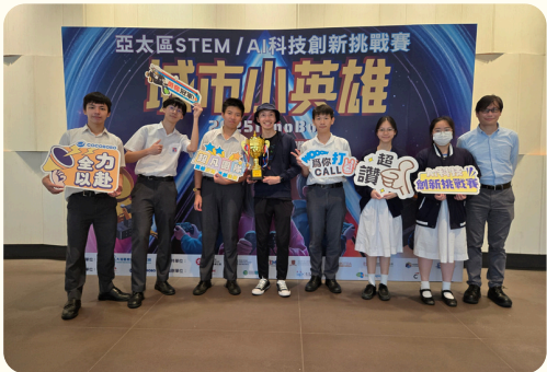
亞太區STEM・AI科技 創新挑戰賽第二名及金 獎