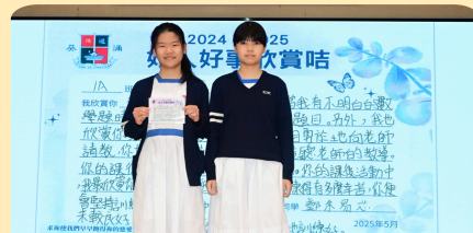
全校教職員親手撰寫讚賞咭，表達對學生的欣賞；同學之間亦會互相表揚，在每學期一次表揚日公開肯定學生的嘉言美行