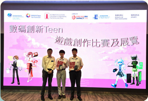
數碼創新Teen遊戲創 作 比賽最具社會意義大獎