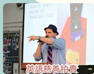
英語慈善拍賣 Charity Auction