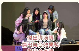
傑出導演獎 傑出舞台效果獎 傑出合作獎 傑出整體演出獎 傑出演員獎（男女主角）

本校變臉隊為全港首支接受系統訓練的 中學變臉隊 ，多次獲邀到社區活動、學校及電視台作示範演出，推廣中華傳統藝術，學生在舞台上建立自信。劇社同學亦積極參與學校戲劇節等比賽，在創作與演出中發揮潛能。此外，本校的 保齡球隊 和 田徑隊 也表現出色，屢次在比賽中取得佳績，展現了學生的運動才能和團隊精神。