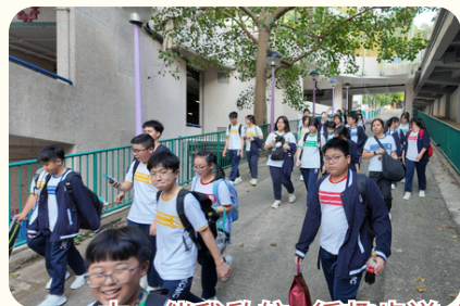
中一伴我啟航 x 循趣步道 x 青協中心社區探索活動

長幼為伴、師友同行，中四五學長帶領中一同學全方位認識往返學校與葵芳的路徑，探索社區設施，親訪社工導師日常的工作環境，促進學校社區的連繫和合作。