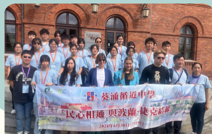
捷克波蘭交流團拜訪布拉格市政府，瞭解當地城市規劃