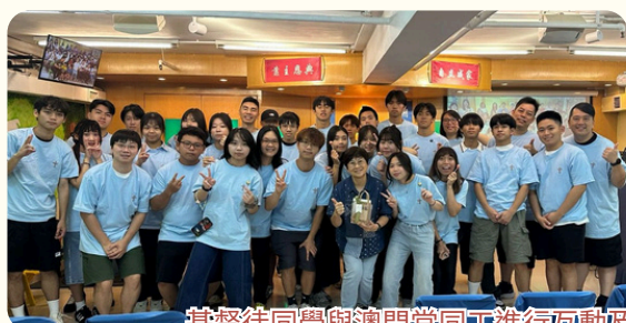
基督徒同學與澳門堂同工進行互動及信仰分享，並體驗澳門文化及生活面貌