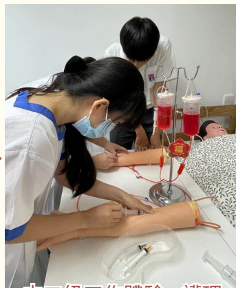
中二級工作體驗—護理