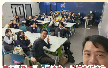
每個星期五早上晨禱會，以詩歌及禱告，數算主恩，同心仰望上帝