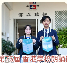
第76屆 香港學校朗誦節 英文雙人戲劇對話冠軍