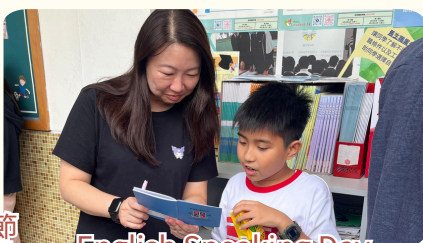
English Speaking Day