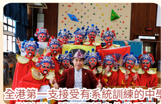
全港第一支接受有系統訓練的中學變臉隊，體現堅毅自信的重要