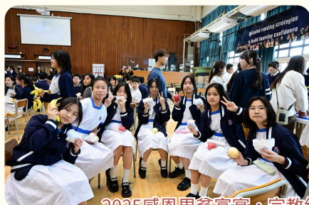
2025感恩周貧富宴，宗教組同工帶領同學感恩事奉，參加師生一起體驗貧窮 實踐關愛