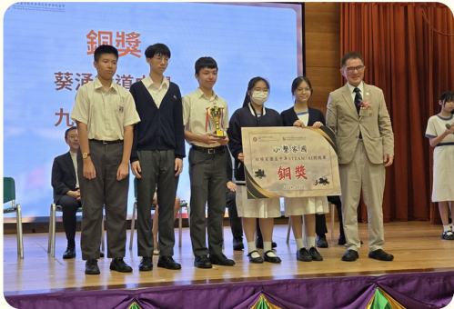
心繫家國STEAM/AI 競技賽銅獎

本校同學積極參與STEM領域的學習，超過150人次參加了二十多個全港及區域性的大型STEAM比賽。在這些競賽中，學生們表現優異，屢次奪得獎項，包括「心繫家國STEAM/AI競技賽」的銅獎及「數碼創新Teen遊戲創作比賽」的最具社會意義大獎等。透過參賽，他們不僅拓闊視野，還深化所學，提升實踐能力和創新思維。