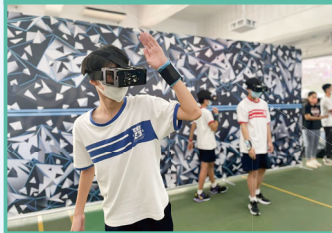
師生HADO電子閃避球體驗