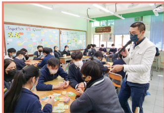
經濟科及企會財科合辦香港小童群益會匯豐校園理財教育課程