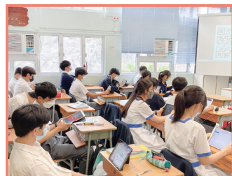
高中設計思維課程