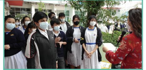
智能飲水機開幕禮