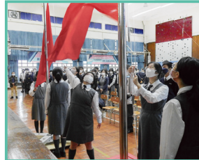
聖誕崇拜暨頒獎典禮