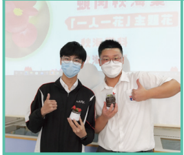
一人一花種植活動