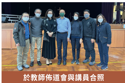
於教師佈道會與講員合照