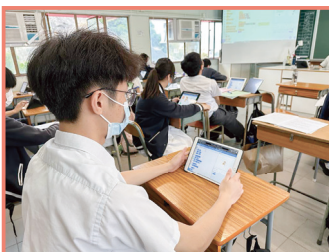
高中AI人工智能課程