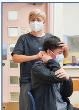
香薰減壓及自我舒緩按摩工作坊