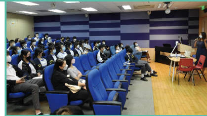
中六級台灣升學講座