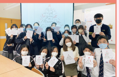
英文書法聖誕卡製作工作坊