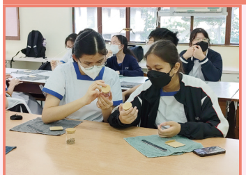
手鐲升級再造工作坊