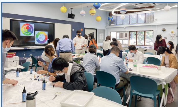
新入職老師同行工作坊