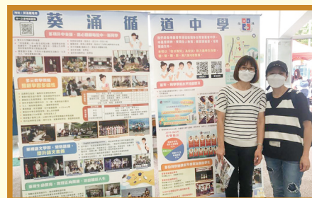
葵青區中小學博覽會