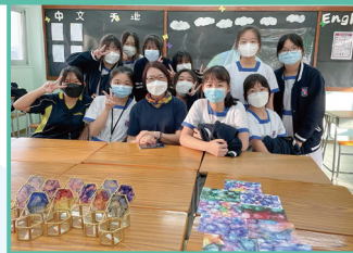
日本酒精墨玻璃飾物盒