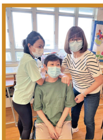
家長教師會與輔導委員會合辦「芳香輕觸之旅」

期望各位家長繼續支持家教會的事工，積極參與各項活動，把家教會家長互助、家校合作的精神發揚光大。