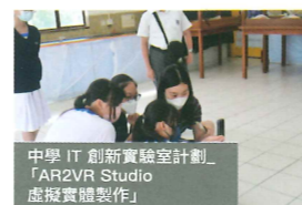
中學 IT 創新實驗室計劃 「AR/VR Studio 虛擬實體製作」