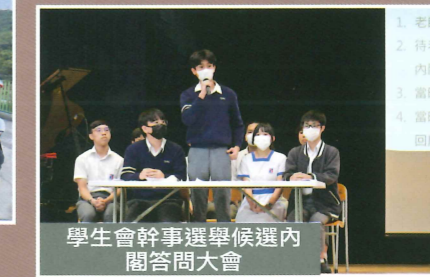
學生會幹事選舉候選內 閣答問大會