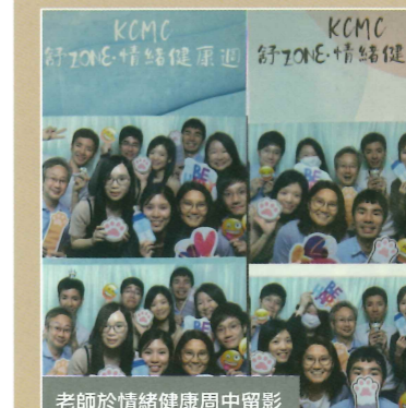
老師於情緒健康周中留影