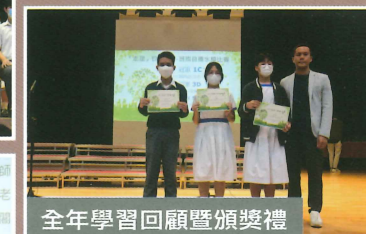
全年學習回顧暨頒獎禮