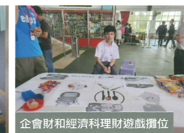
企會財和經濟科理財遊戲攤位