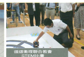
循道循理聯合教會 STEM比賽