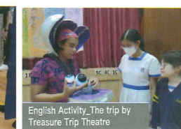
English Activity_The trip by Treasure Trip Theatre