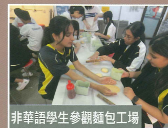
非華語學生參觀麵包工場