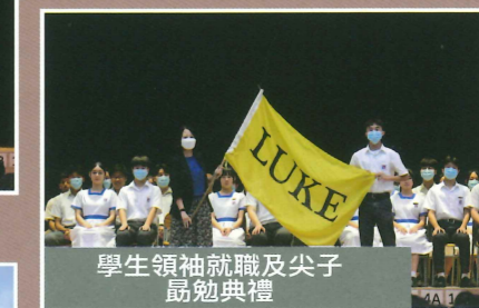
學生領袖就職及尖子 島勉典禮