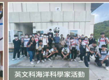
英文科海洋科學家活動