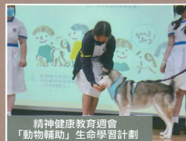
精神健康教育週會 「動物輔助」生命學習計劃